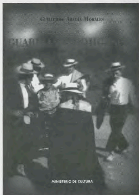
Guillermo Abadía Morales Guabinas y mojigangas Centro de Documentación Musical Ministerio de Cultura 80 páginas 1997