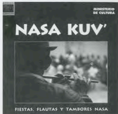
Nasa Kuv' Fiestas, flautas y tambores nasa Fundación de Música Consejo Regional Indígena del Cauca Centro de Documentación Musical Ministerio de Cultura 1998