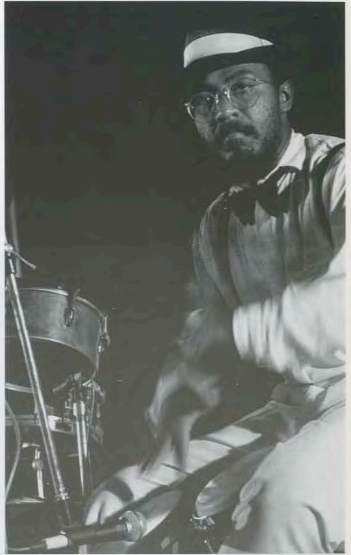
Guayaón, Colombia, 1987