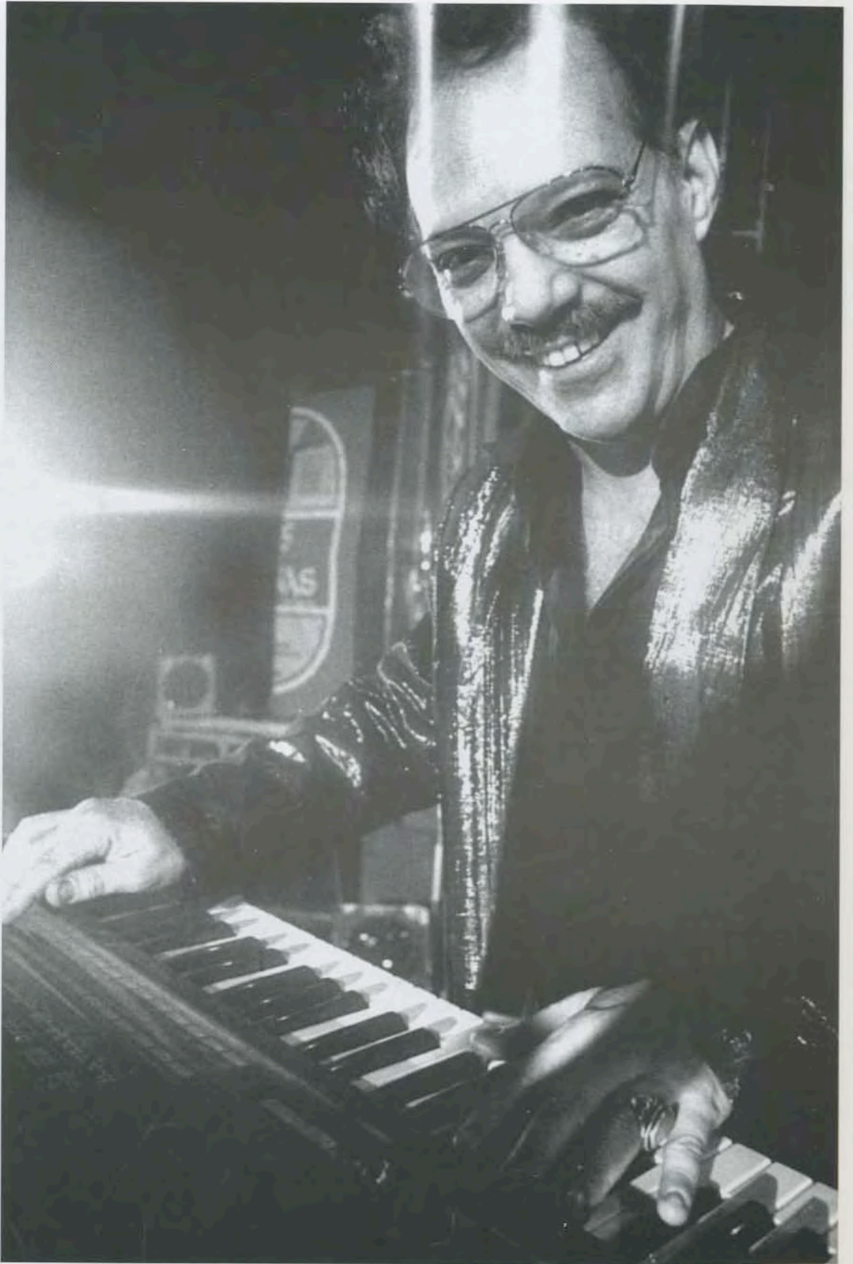
Larry Harlow, Estados Unidos. 1986