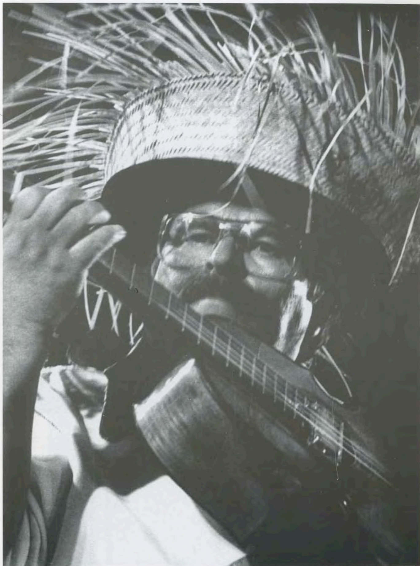
Yomo Toro, Puerto Rico. 1988