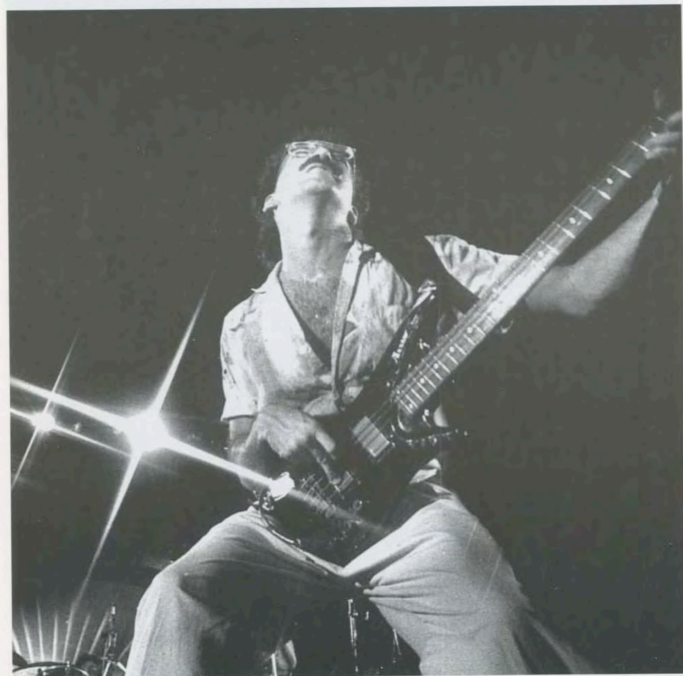
La Familia André, República Dominicana, 1985